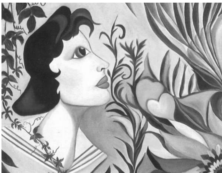
Briguglio Ester - Paradise