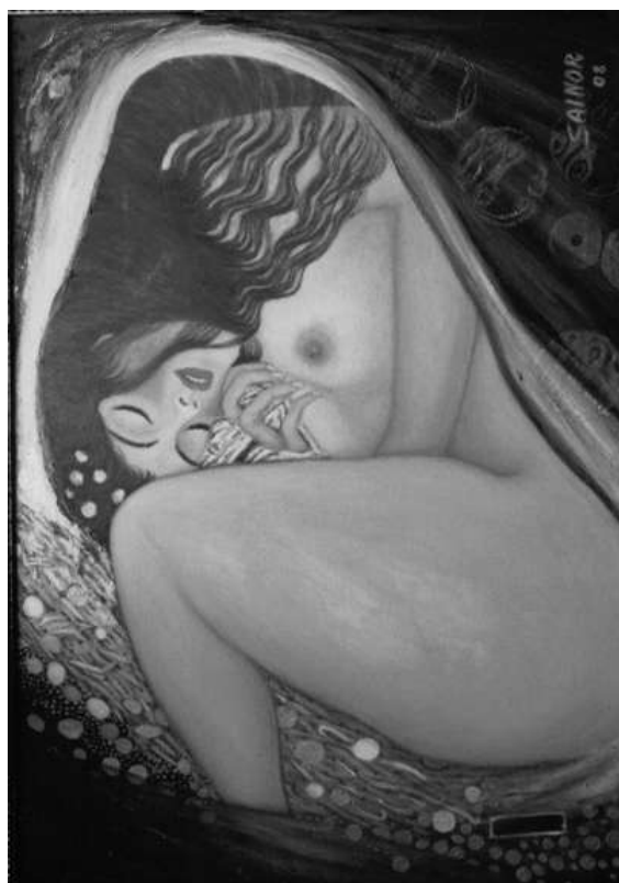
Orsini Santa - Danae di Klint - olio