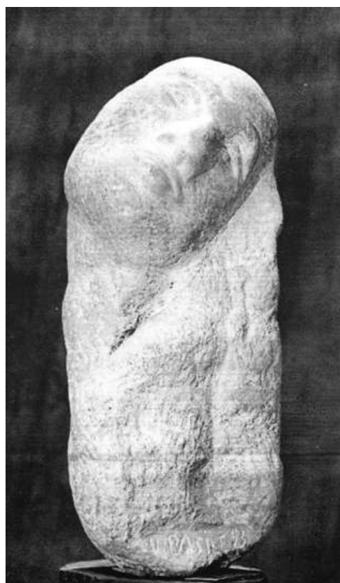
Basile Vittorio - Scultura in pietra marmorea