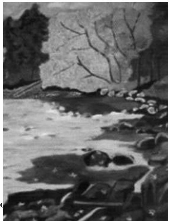
Aimone Ceschin Tina - Ruscello