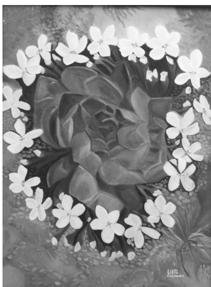
Lietz Carmen - Columbine