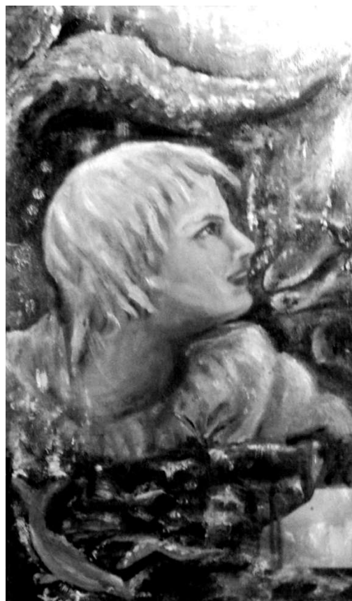
Artese - La Sirenetta